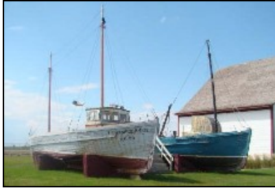
Banc de pêche de Paspébiac – 2009 Les morceaux rapatriés proviennent de ses deux Gaspésiennes...

Les Compagnons du chantier maritime A.C. Davie ont tenté de sauvegarder, in extremis, 2 Gaspésiennes construites au chantier A.C. Davie et qui s'étiolaient sur le site du banc de pêche de