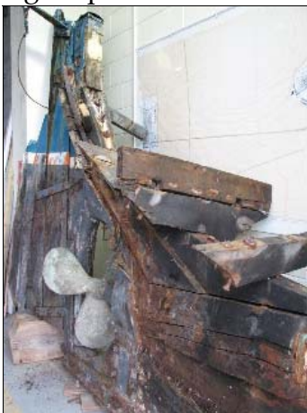
Gouvernail d'une Gaspésienne - 2009